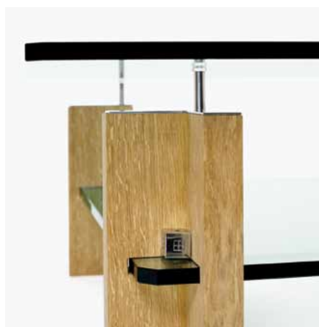
T57D Eiche / natur Aluminium glänzend oak / natural aluminium polished eiken / natuur aluminium glans