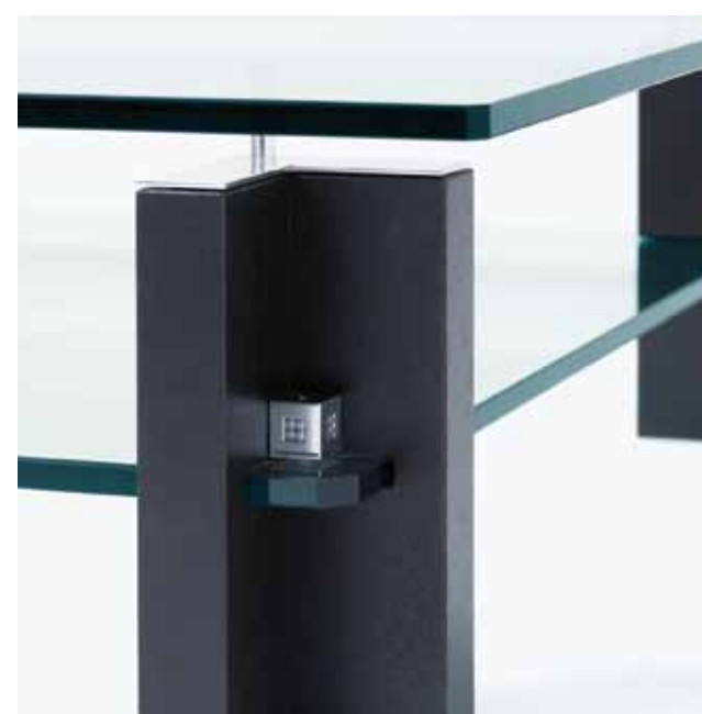
T57D Eiche / wenge Aluminium glänzend oak / wenge aluminium polished eiken / wengé, aluminium glans