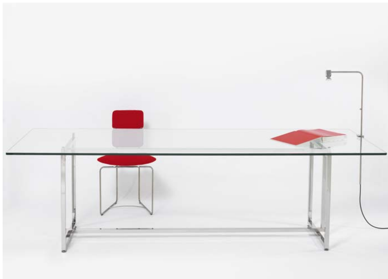
T75 + S02 + MW11T † 75 cm ☐ 100 x 260 cm

Edelstahl glänzend, Nickel glänzend Stainless steel polished, nickel polished Roestvrijstaal glans, nikkel glans