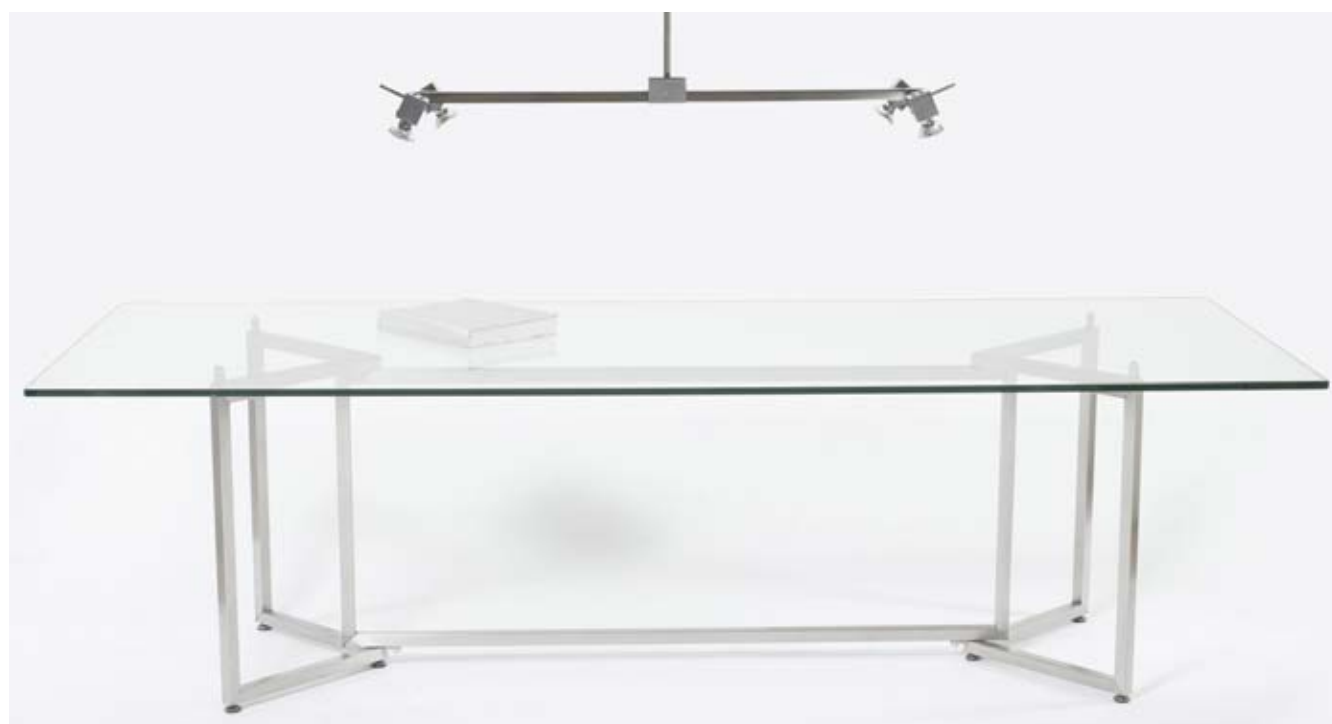
T75V + MW12D † 75 cm ☐ 100 x 260 cm

Edelstahl glänzend, Nickel glänzend Stainless steel polished, nickel polished Roestvrijstaal glans, nikkel glans