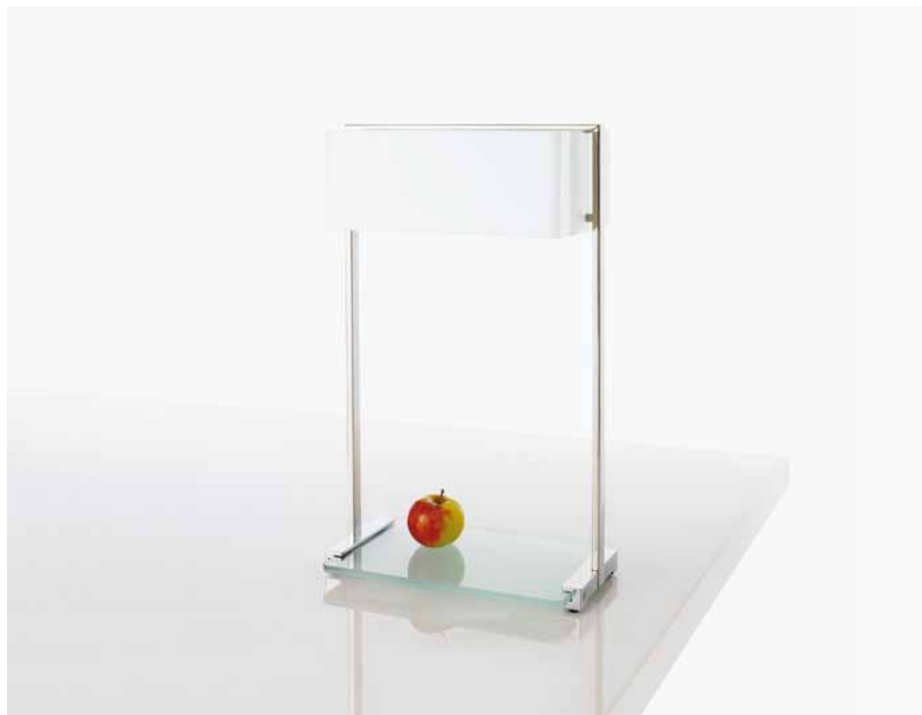
MW10 ↑ 57 cm

Edelstahl glänzend, Aluminium glänzend stainless steel polished, aluminium polished roestvrijstaal glans, aluminium glans