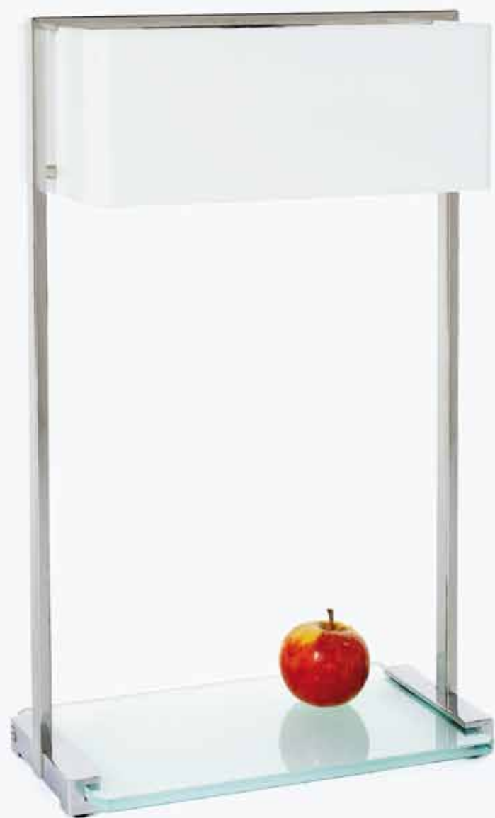
MW10 ↓ 57 cm

Edelstahl glänzend, Aluminium glänzend stainless steel polished, aluminium polished roestvrijstaal glans, aluminium glans