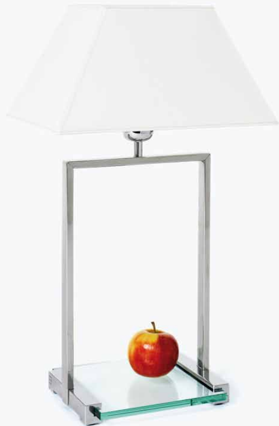
MW9/1 ↓ 50 cm

Edelstahl glänzend, Aluminium glänzend stainless steel polished, aluminium polished roestvrijstaal glans, aluminium glans