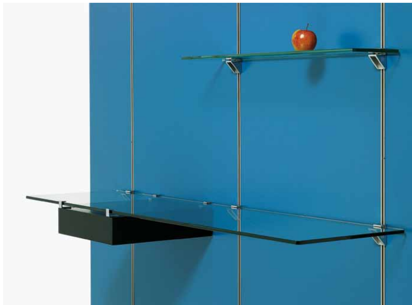
RP2 + R20/10 + D04